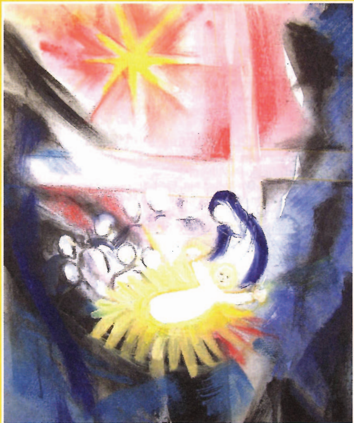
Dietlinde Assmus, Düsseldorf, Weihnachten 2011. Mischtechnik auf Leinwand, 50/40

3./4. Advent/Weihnachten/Silvester 17.12.2017 - 07.01.2018