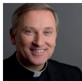
+Wilfried Theising Bischöflicher Official und Weihbischof

Gerne greifen wir Ihre Bitte von der Startklar-Veran- staltung im letzten Jahr auf, weiter mit uns über den Wandel der Kirchengestalt und die damit verbunde- nen Abbrüche – aber auch über Aufbrüche in eine Kirche der Zukunft nachzudenken. Aus diesem Anlass lade ich Sie ein, an unserem Zukunftsforum zur Kir- chenentwicklung im Oldenburger Land teilzunehmen. Spannende Impulse und Workshops mit kompeten- ten Referentinnen und Referenten warten auf Sie. Ich freue mich auf Ihre Teilnahme und gute Gespräche!